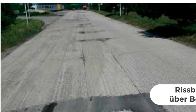
Rissbildungen über Betonfugen