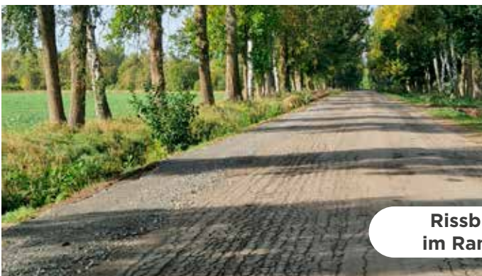
Rissbildungen im Randbereich