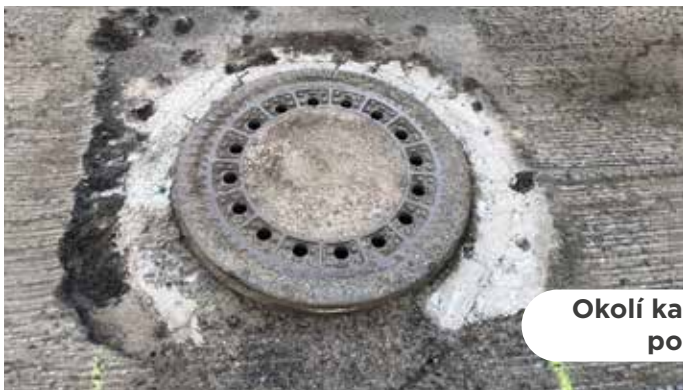
Okolí kanalizačních poklopů