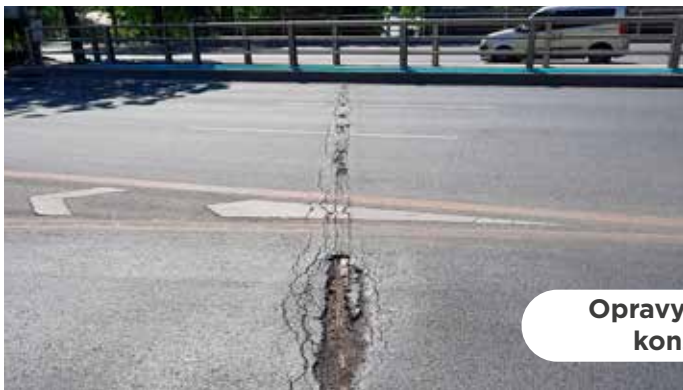
Opravy mostních konstrukcí