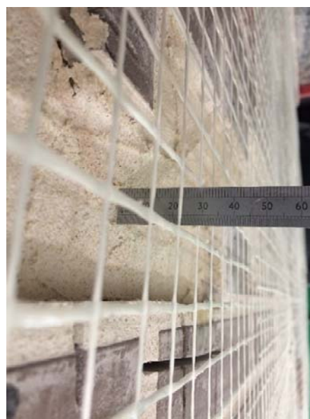
Figure 2 : Maquette avec treillis ADFORS Vertex® Reno : vue générale et détail au niveau d'un relief négatif