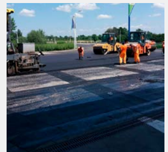
Einbau von ADFORS GlasGrid PG in Belgrad, 2018