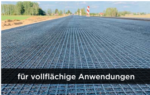
für vollflächigen Anwendungen

Rissbewehrung und strukturelle Verstärkung von Asphaltsschichten | Selbstklebende Gitter auf bestehender oder neuer Oberfläche | Gitter mit Verlegehilfe oder Vliesstoff auf gefräster Unterlage