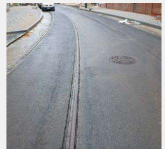
Einbau von ADFORS GlasGrid in Prag, 2013