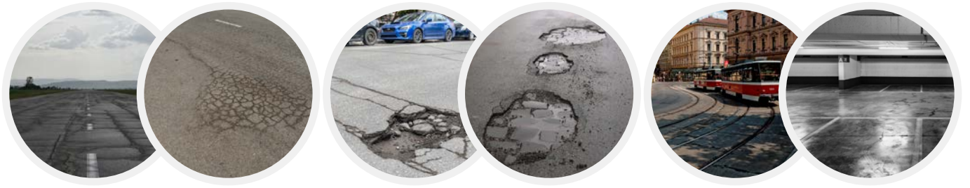
Schadensfall für vollflächige Verlegung