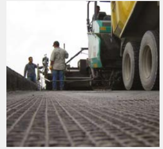
Einbau von ADFORS GlasGrid am Atatürk Airport, 2010