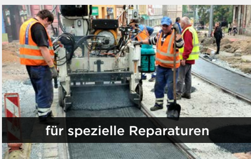
für spezielle Reparaturen